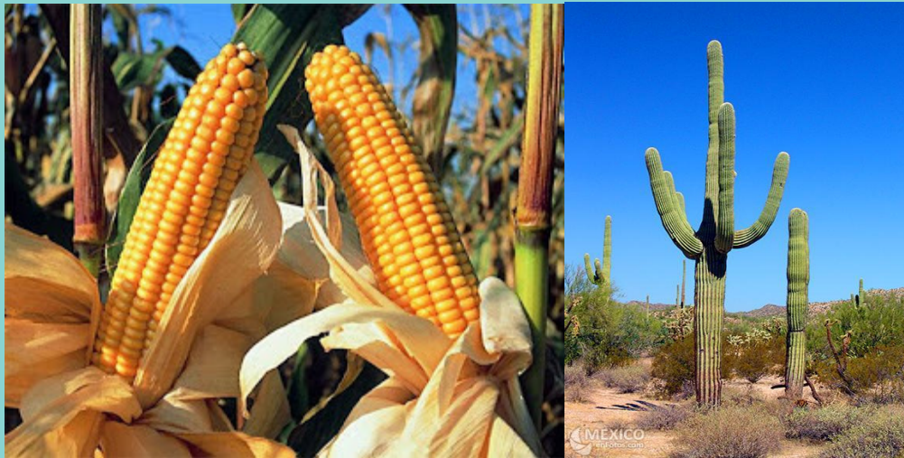
Fig.2: Ejemplo plantas C 4 y CAM (respectivamente)